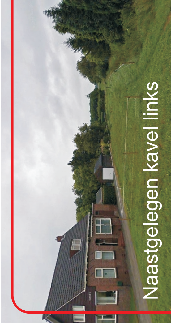
Naastgelegen kavel links