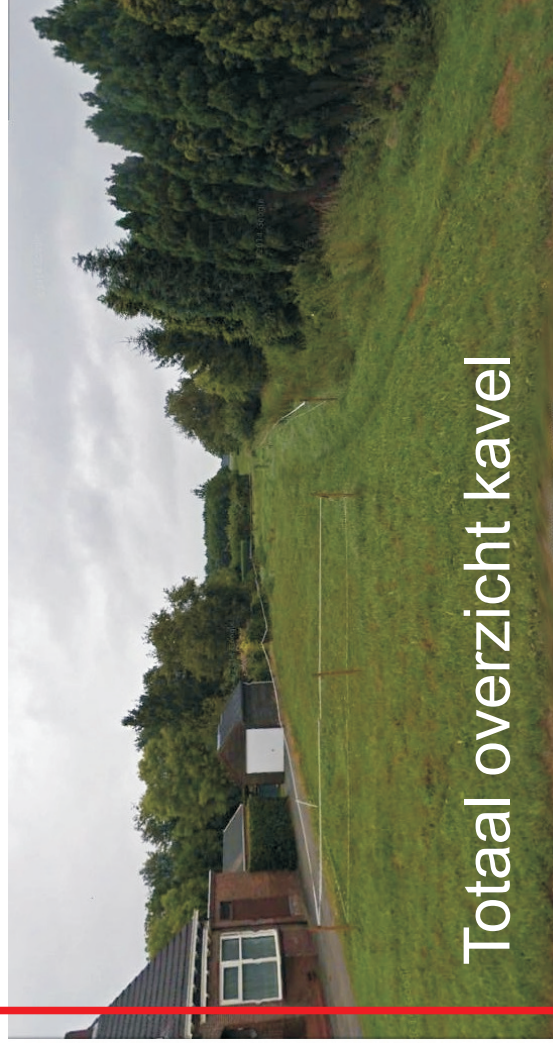
Totaal overzicht kavel