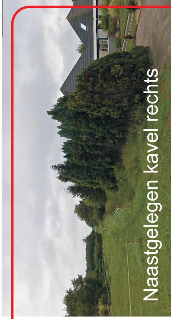
Naastgelegen kavel rechts